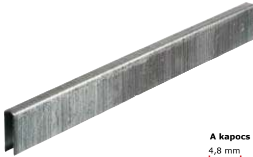
A kapocs 4,8 mm